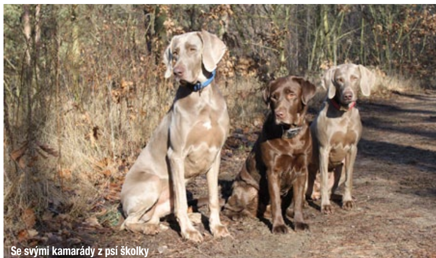
Se svými kamarády z psí školky