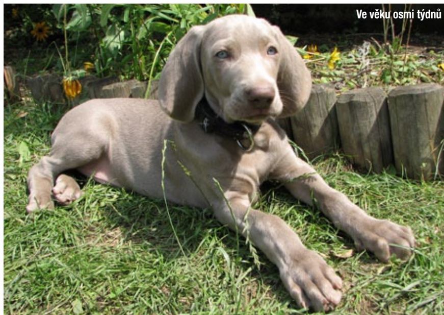
Ve věku osmi týdnů

Dvakrát až třikrát v týdnu, což je myslím adekvátní i z hlediska zátěže a relaxace. Chodí tam rád, i když vůči té cvičitelce má svým způsobem respekt. Když se vrátí, je na něm vidět, že je utahaný, ale šťastný. Po zbytek týdne je doma nebo u mých rodičů, kde to má taky rád – i pobyt na venkově pro něj má svou poezii. Vyběhá se zahradě a společnost mu dělají slepice, které si spíše hlídá a „počítá“, než aby je zakousl. I když ze začátku to byl trochu problém... Ale lovení slepic se už našťastí odnaučil.